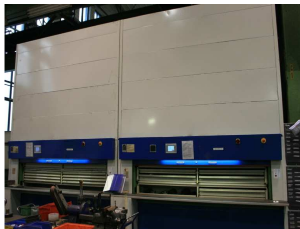
EAGLE Integration in zwei Megamat Paternoster